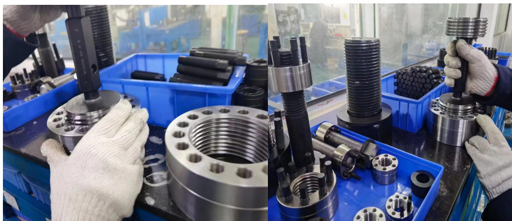
超级螺母_通止规出厂检测