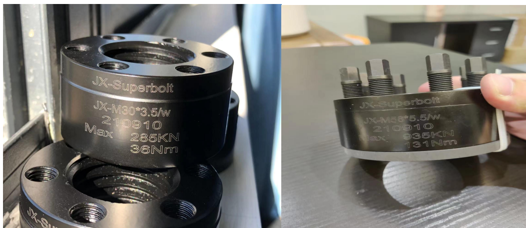
超级螺母 M30_发黑定制